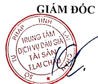
Đỗ Khắc Tiến